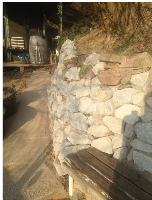
Odenwälder Granit, unterm Haselstrauch im Februar trocken gemauert